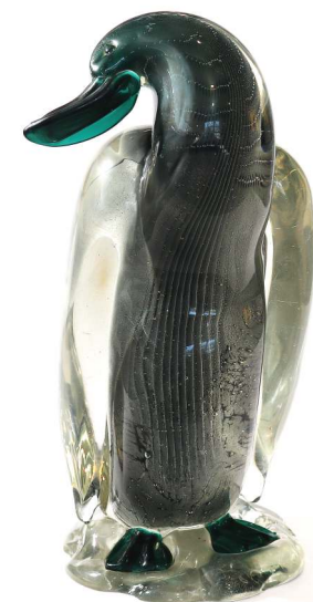
Glasente, Murano um 1938

Zusätzlich zu diesen heimischen Ausstellungsstücken vermitteln über 300 ausgesuchte Leihgaben, aus renommierten slowenischen und kroatischen Museen, einen Eindruck von der unglaublichen Vielfalt und Einzigartigkeit der hochwertigen Handarbeit aus Murano, Österreich, Deutschland, Niederland, Tschechien, England, Frankreich bis hin zu Slowenien und Kroatien.