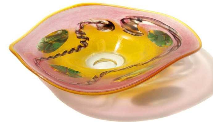
Glashütte Stoelzle Bärnbach

Ganzjährig geöffnet und frei zugänglich bietet der Werksverkauf eine Vielzahl von Erzeugnissen aus der Stölzle – Produktion und immer wieder Neues, Schönes und originelle Geschenkideen aus Glas.