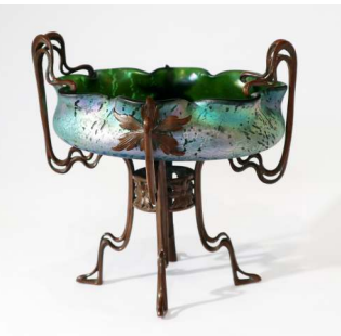
Schale, Loetz Witwe um 1900