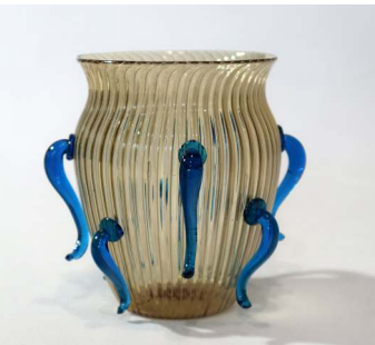
Vase mit Flügelansätzen, Murano