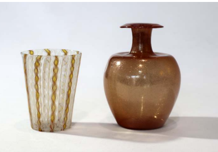
Venezianischer Glasbecher Vase Aventurin